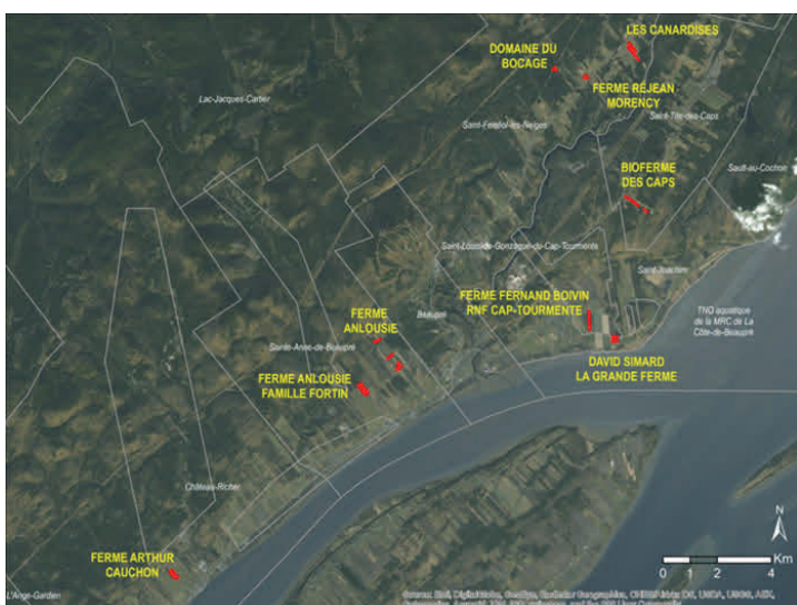
Figure 1 : Localisation des projets de plantations

Sur la Côte-de-Beaupré, entre 2014 et 2017, ont été réalisés :