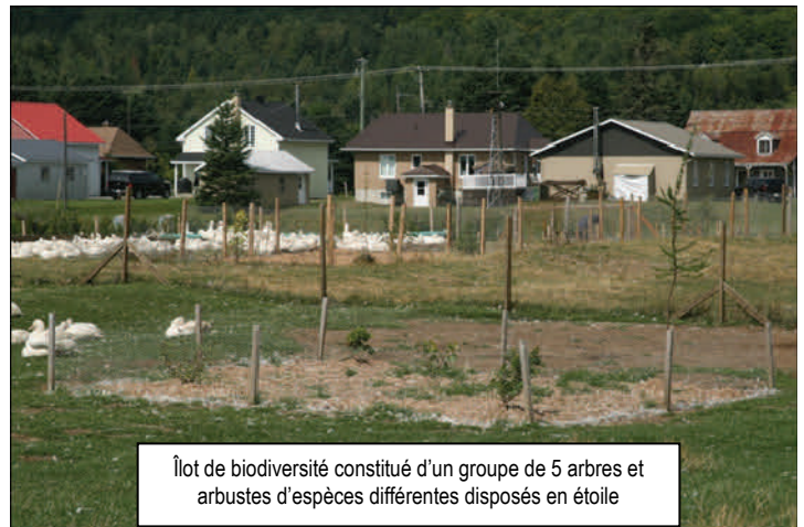
Îlot de biodiversité constitué d'un groupe de 5 arbres et arbustes d'espèces différentes disposés en étoile