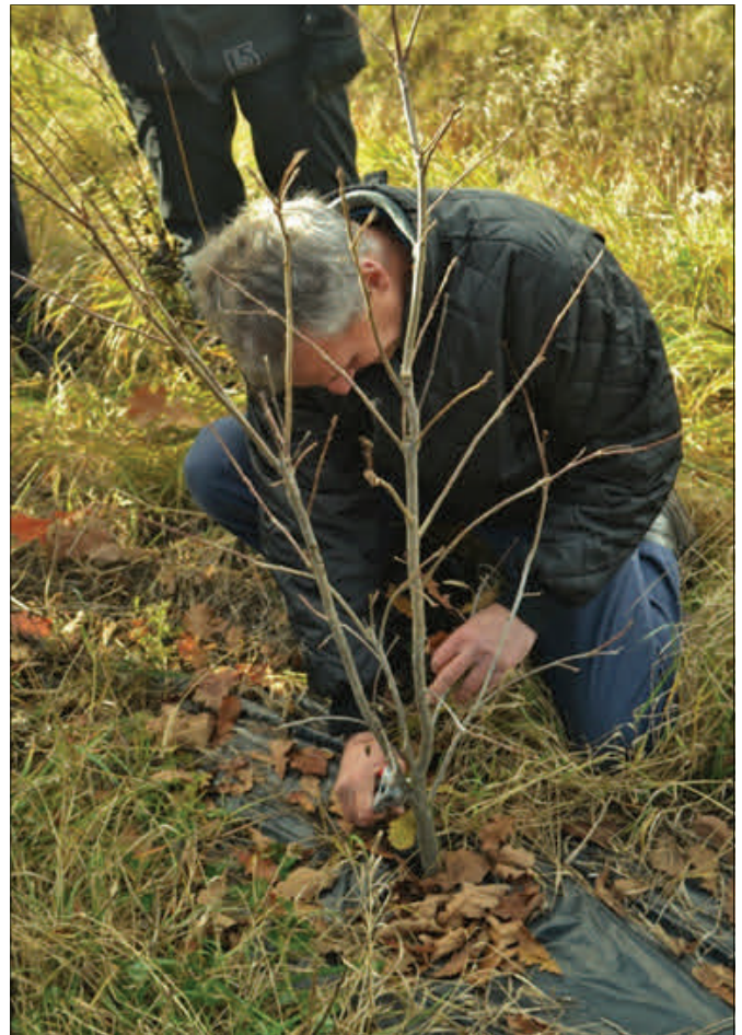
Figure 5 : Exemple de taille de formation d'un plant d'érable de 2 ans (suppression d'une fourche et choix de la tige maîtresse d'avenir)

Un petit guide sur l'entretien des arbres en haie brise-vent et bandes riveraines a été produit par le CERFO et est disponible sur http://cerfo.qc.ca/index.php?id=166 .